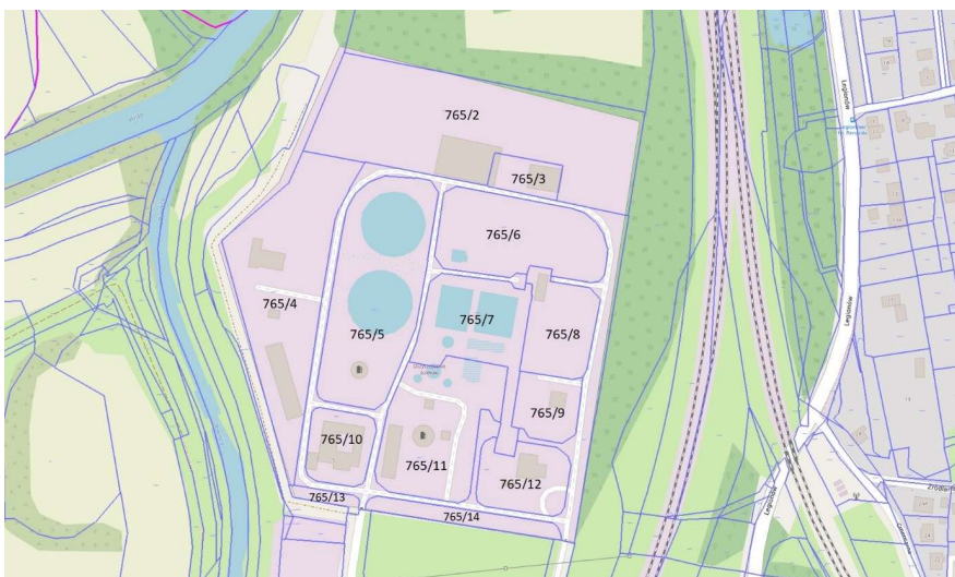
Rysunek 1. Lokalizacja oczyszczalni na tle podziału ewidencyjnego

Lokalizacja inwestycji została przedstawiona na planie sytuacyjnym stanowiącym załącznik nr 2 do PFU. Na obszarze objętym opracowaniem zasadniczo nie występuje kolidująca roślinność drzewiasta, w związku z tym na obecnym etapie nie przewiduje się wycinki zieleni.